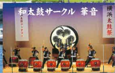
和太鼓サークル 筆音