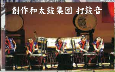
創作和太鼓集団 打鼓音