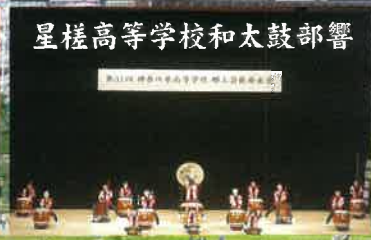
星槎高等学校和太鼓部響